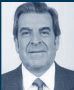
Eduardo Frei Ruiz-Tagle, Presidente de Chile (1994-2000)

¿Acaso Bolivia olvida que las dos conversaciones que hubo en 1950 y en 1975, para buscar una solución a su mediterraneidad, fracasaron y no precisamente por responsabilidad de Chile?