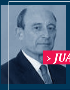
> JUAN EMILIO CHEYRE

2.- ¿Cree usted que un fallo favorable a Bolivia obligaría a Chile a ceder soberanía bajo forma de negociación?