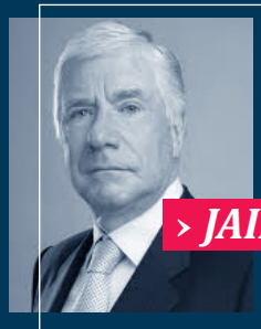
> JAIME RAVINET

2.- En ninguna circunstancia un fallo podría obligar a Chile a ceder soberanía. Ninguna Corte podría desconocer tratados plenamente vigentes con límites establecidos y ratificados. Tampoco podría pronunciarse sobre materias que solo competen a acuerdos de carácter bilateral. Una fórmula de negociación no podría estar condicionada a ninguna solución preestablecida por una Corte como la de La Haya. Pienso que ni siquiera ésta podría definir una forma concreta de solución de controversias, como la negociación, pues no compete a la Corte establecer un procedimiento entre los muchos que existen para resolver diferendos entre los Estados.