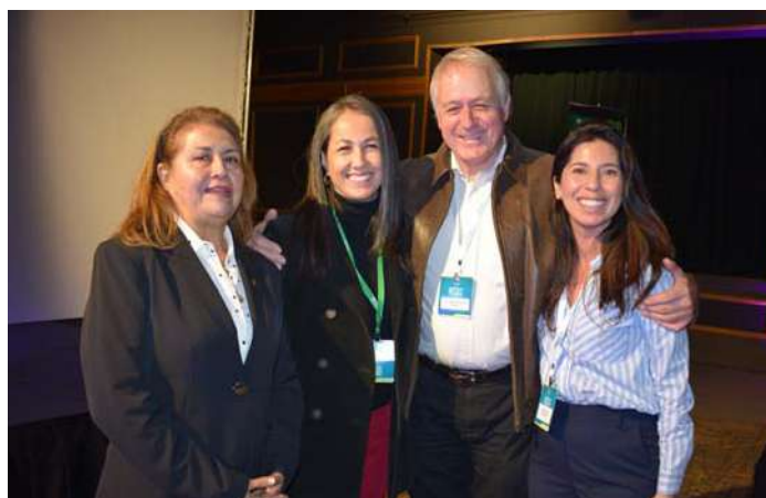
"El impacto de la Inteligencia Artificial en el Desarrollo de la Agricultura Nacional" fue el tema abordado.